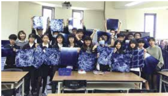
· 圖3：社區課程學習成果展示分享。

有了上述的成功經驗，110學年度本校更積極與國際教育進行結合，雖然後續受到疫情的影響，但教師群仍然以線上共學的模式，帶領學生與國際友人共學分享，其中包括美國、丹麥、日本、東南亞等地的學校，學伴們皆對三峽藝文生活留下深刻的印象。接著，教師社群將課程與新興科技結合，並與國立臺灣科技大學的新創實驗室合作，導入聊天機器人、凱比機器人等數位工具創造多樣的學習途徑，也透過AR、VR技術的應用，讓學生以多元的方式介紹在地特色。我們還引入數位科技公司的專業技術指導，結合社區GIS的系統，由學生發想設計在地議題的數位走讀地圖，再將之前繪製的「三峽茶鄉走讀地圖」升級成為「三峽茶鄉數位走讀地圖」，成為地方產業與教育結合的創舉。而在藍染課程中，教師社群加入了車縫、設計、打版等實作課程，透過循序漸進的學習與引導，學生的作品更具實用性，也兼具個人創新與技法的風格。