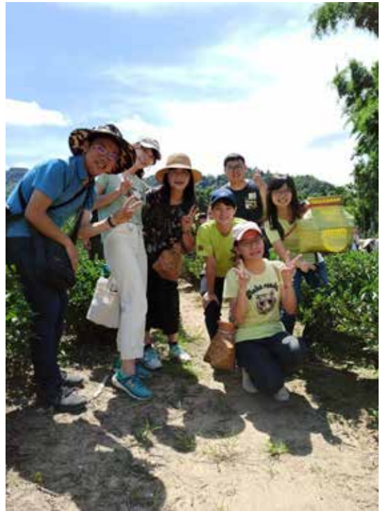
· 圖1：天芳茶行採茶趣。

製茶的第二步在於將茶菁多餘的水分蒸散，稱之為「走水」，發展課程的方法亦復如此，透過去蕪存菁的篩選，才能聚焦與深化。本校於105學年度正式掛牌成為國家教育研究院的研究合作學校，並於106學年度獲選成為