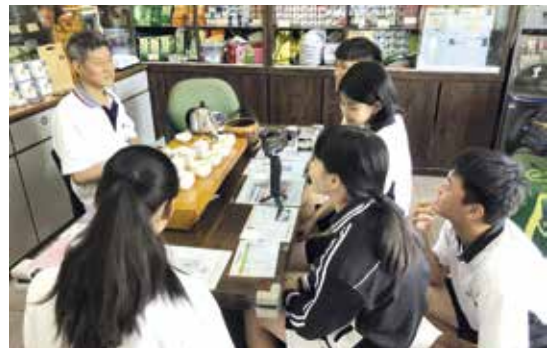
· 圖2：茶鄉訪談記錄祥興行。

至於「藍染生活」特色課程，則是從校園植物的槌染開始，發覺原來不同植物具有豐富多元的色彩要素，進而理解藍染的基本原理；接著，學生再以音樂、戲劇、遊戲、專題報告等多元形式，介紹臺灣與世界許多地區的藍染文化；在技巧精進方面，從綁、紮、縫、絞等技法分組練習與創作，最後於學期末進行主題布展。此外，除了透過實作驗證學理知識外，