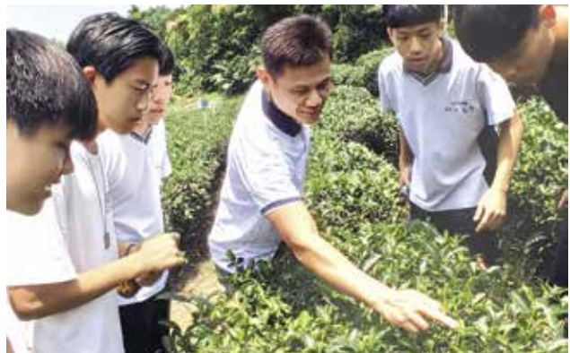
· 圖6：學生走訪茶鄉製茶職人暢談植茶辛酸。