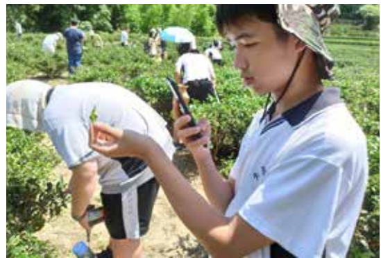
· 圖7：學生探究一心二葉。

當學生將這些美好的分享經驗轉化成為學習歷程檔案，在大學面試時侃侃而談，皆能讓教授們感受到學生在課程學習中的投入與用心。此外，我們也積極鼓勵孩子延伸所學參加競賽，2022年本校師生參與三星創意提案競賽，以「一心二葉AI辨識系統」提供茶農最佳採摘決策，（圖7）不但一舉進入決賽，還以優選獎（第三名）的佳績獲得肯定。筆者深信，當課程發展能走向精緻化，學生就能獲得