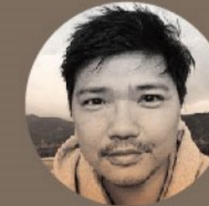
導演 | 龔萬祥