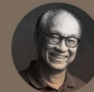
剪輯指導 | 廖慶松