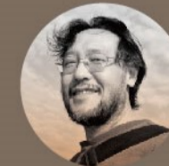
剪輯指導 | 滕兆鏞