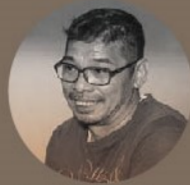
燈光指導 | 譚紀良