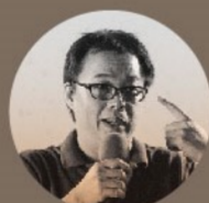
攝影指導 | 錢翔