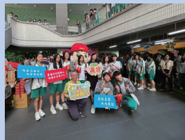
高三學測祝福活動，激勵學測戰士。