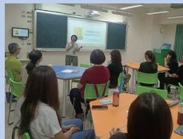
家長熱情參與「教養是合作」成長工作坊。