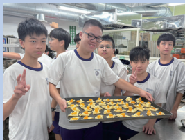
技術型高中參訪，探索生涯發展可能性。