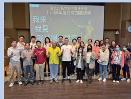
教職員工特教知能研習—我來，我見，我征服自閉症。