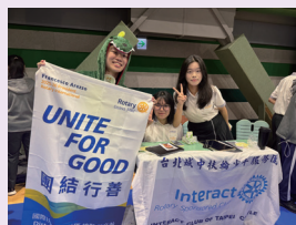
動靜皆精彩的社團博覽會。