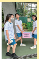
圖書館利用教育— 以遊戲進行圖書館知識挑戰。