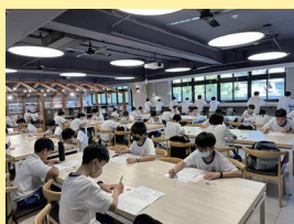
程式設計班甄選— 萬中選一、專注應試。