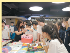
校慶書展— 加碼摸彩，學生期待又興奮。