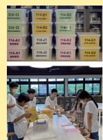
班級書箱活動— 人手一書、快樂閱讀。