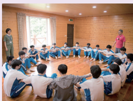
高一新生探索體驗團隊思考過程。