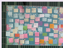
滿載學生心意的敬師感恩牆。