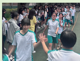
比賽後與對手擊掌致意。