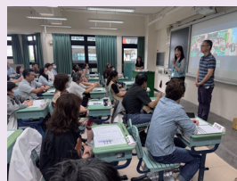
學校日親師齊聚，守護孩子未來。