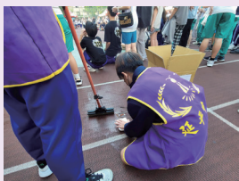
環保志工跪地清掃，不怕髒的身影最動人。