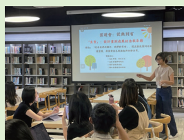
導師社群定期聚會，研討品格如何融入校園活動。