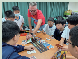
專注投入，桌遊讓學習更有趣。