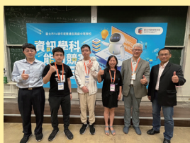
114年資訊學科能力競賽— 榮獲三等獎及佳作。