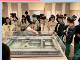
人權教育— 景美人權文化園區參訪。