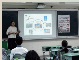
海外大學升學講座。