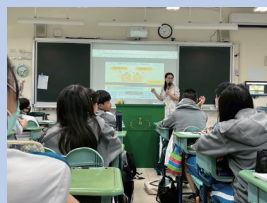
高中學習歷程— 課諮老師入班導讀。