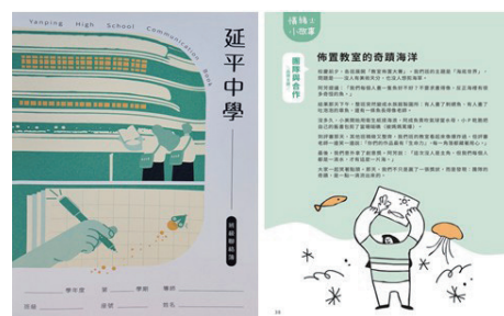
富含情緒小故事的新版品格聯絡簿

我們期待，在三、五年後，即使在無人的校園走廊，或孩子畢業後進入社會的每一個場域，「聰明與善良」都能自然流淌—成為延平人深植的 DNA。