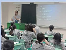
高中多元選修— 我們與法的距離。