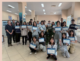
澳洲教育旅行圓滿結業。