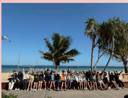
陽光、海風與笑聲，最棒的澳洲學習旅程！