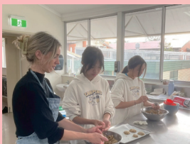
澳洲入班課程—烹飪課動手做的歡樂時光。