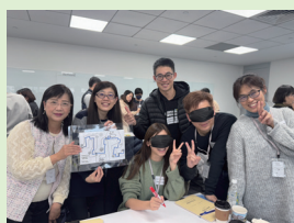
參與宏達文教基金會之品格實踐共識營。