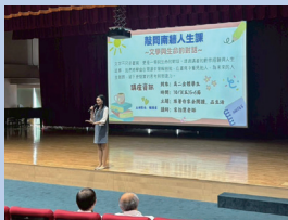
高二南牆人生講座—跟著作家去閱讀品生活。