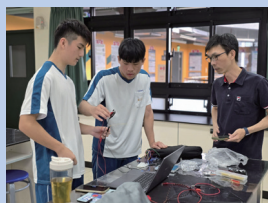
高中自主學習— 校園不同的學習風景。