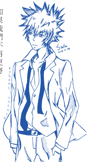
繪圖 / 高三 10 成以琳

作者：嚴長壽 出版社：寶瓶文化事業有限公司 看完了這本書，我內心的心情有如「萬馬奔騰」一般的激昂，剛開始看到這本書的書名，本以為是一本感人肺腑的小說，沒想到卻給我敲下了一記警鐘：雖然我還只是一位剛進入國中三個多月的七年級生，但因為現在傳播媒體的發展越來越強大，我了解到現在很多讀完大學的人，還會一再地去修碩士甚至到博士，修學本來就沒有什麼不對，但因為很多人，他們只是怕出社會受到挫折與失敗，而不敢跳脫出來。人，到底要怎樣 做才是完美的，是要朝向功課頂尖的人去前進，還是往品德高尚的方向前進呢？功課好、品性佳，是最高目標，但我認為：千萬不要因為要前往這方面而束縛住自己，每個人都有屬於自己的特色，不應為了要跟那些優良近乎完美的人一樣，而變成了他或她的「複製人」，每個人都應該發掘出自己的優點、特色，並展現出來，像我：我覺得自己的優點是不會隨便排擠別人，也會大方的去交朋友，這是我的優勢，我應該要把它展現出來，至於我的缺點……我覺得應該是不好，因為我絕對沒 但書中曾提到，我們應該要努力的糾正缺點，讓它變成另一個優點。這本書也讓我學到：「性格會影響一個人」，書中就舉都是法律畢業的律師與法官，當律師的人必須夠敏銳、機伶，隨時因應情況；而當法官的人，就應該公正不阿，不能因人、因事，更不能因勢而有所不同；其實，我未來也想像一個法官，而且我的個性從小就是屬於很有正義感的那種，只要同學有做錯什麼事一定都會跟老師報告，我媽就說：「如果你這種個性去當律師的話，絕對賺不到半毛錢。」我也這麼認為，因為我絕對沒