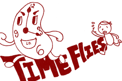
繪圖 / 高三10 張詠晴

天空俯視，正好呈一個「日」字形，有極趣了。走過熙來攘往的臺北街頭，仔細看著，除了來來去去的車以及閃爍的燈光外，可以看見歲月在臺北留下的腳印。仔細傾聽，除了行人的聲音以及汽車聲，還可聽見臺北的歷史。