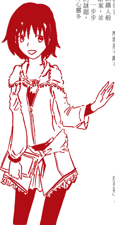
繪圖 / 國三4 蕭雅瑜

書中福爾摩斯身陷在毒癮當中，但是儘管「戒毒」這件事在精神上是具有多大的傷害，他仍靠著他那鋼鐵人般地意志繼續辦案，並隨著蛛絲馬跡，一步步揭開犯人設的謎題，福爾摩斯不啻身心靈多麼疲憊，依然要完成工作的態度，我想這是我應該要學習的，像有時我會因為身體感到些微的不適，就想跟補習班請假，即便那只是頭