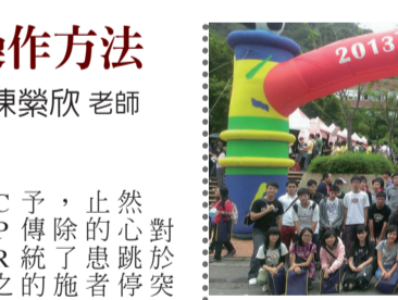
2013 政大包包種茶節共 58 人參加，大家當天收穫滿滿！

儀器的使用，其實不是很了解，剛好透過今天的研習，有機會可以知道該如何正確使用這樣的儀器，以備不時之需。