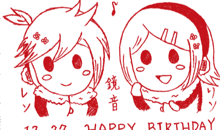
繪圖/高三 8 林佳璇

不知不覺寫了很多，是因為這五天的中醫研習營讓我擁有了很大的動力。不知道自己是否實現了去年的期許，但我一顆閃閃的星星，將繼續努力朝著不斷進化的夢想前進，然後，實現那晚上的願望，變得更強！