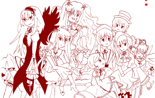
繪圖 / 國三 7 賴品樺

爭先恐後的散了去，後生成的緊迫著先生成的圓，形成一幅熱鬧的畫面；有時不幸遇上絆腳石——或是浮萍，或是青蛙，圓便被迫打散，碎成凌亂的波紋而漸漸散去。 望著小湖上此起彼落的圓，我的心亦如同丟進一顆小石而泛起一陣漣漪。古代畫家無規矩輔助時，欲畫圓，便將手竭盡所能的伸直畫轉一個圈。我不禁聯想：人在世上，應向這些簡單平凡的圓學習，盡所能將幫助他人的手伸到最遠處。一開始到，它：它依舊彷彿遠：遠在天邊一：一樣，拿：拿也拿不到：不到。」 李雲飛和王綾芝隨即飛奔上山，瞬息間便來到熊掌洞前。李雲飛這才想起，依稀是他父親李天嘯在那懂懂之年，在這洞口對面，他殷殷教誨。如今他以蛻變成他，想到這裡，他不禁潸然淚下。直到王綾芝悶咳一聲，他才想起來這的目的。 兩人互使個眼色，即闖入洞穴，他們很快的找到了機關門，輕推而入，想不到馬上聽到「嗖！」，李雲飛隨即拉回機關門，結果「嘩！」的一聲，兩支飛鏢刺出門板，兩人都倒抽了一口氣。回過神來，再度輕推而入，迅速伏在地上察覺四周動靜。只見背後有兩個紅色圓影，即便聽見「咻！咻！」兩聲，李雲飛抽劍而出，順勢一掠，兩支暗箭瞬間一分爲一，落在地上。再往地上一摸，一條裂