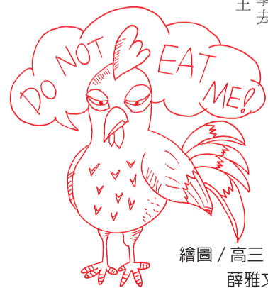
繪圖 / 高三5 薛雅文