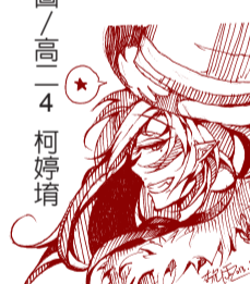
繪圖/高一 4 柯婷培

樣，但是漸漸到了可以加入的年紀，卻沒有報名的勇氣，因為我的柔軟度並不好，這意味著我學習跳舞將要比別人付出更多的努力，為了不讓人生留下無法填補的空缺，四年級時的我終於決定加入代表學校參加比賽的團隊。