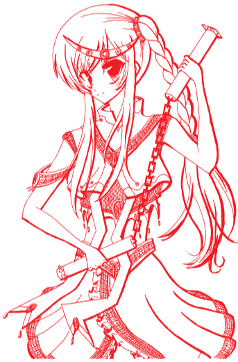
繪圖 / 國二 1 李姿蓉

師傅，他很感慨世代迅速的轉變，以往的鄉村人情味早已煙消雲散，伯父很欣慰自己的兒子願意傳承這特有的辦桌文化，而我也希望現代人可以漸漸重視，並想起這些曾經帶給我們圓滿溫暖的特有文化。