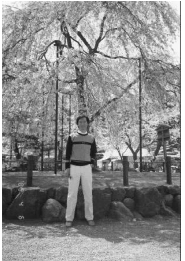
京都紅枝垂櫻月下更是曼妙撩人

來越有神情，越來越有姿態。她好像真的跳起舞來了！ 腳尖輕輕提起，手指柔柔比劃，纖腰嫵媚旋轉，眼波流轉，忽喜、忽愁、忽嬌、忽柔、忽怨……一舉手、一投足、一顧盼、一旋轉，無不情姿連連。 發條鬆了，旋轉台轉止不動，人偶又恢復原貌。 真是太奇妙、太迷離了！ 噢！爸爸怎麼會知道？ 在咖啡屋寫至此，關上 iBook 回家，一路又冷又雨。 到了家，書桌上放著幾封信，拆開看，全都是學生寄來的。 其中有一封還寫道：「我們的畢業照是在學校附近仁愛路的一棵木棉花樹下照的，老師說：『木棉花的樹枝如千手觀音，花朵則是手掌上擎著的盞盞燈火，希望能照亮你們的智慧與前程。』其實老師的話才是燈火，照亮懂懂的我，最後那幾個月我才能努力用功，考上理想的大學……」 愧疚我也！想不到自己無意中的一句話影響學生這麼大，身為教師，言行可不慎乎？與其說我是他的燈火，不如說他是我的燈火，是他點燃了我的信心。 燈如紅豆最相思，在檯燈下展讀你們的來信，好想念你們！屋外雖淅風苦雨；屋內卻有燈有情，我是個幸福的人。