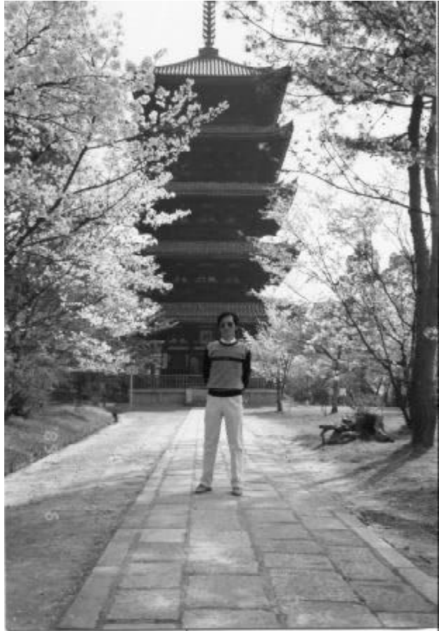
古塔襯櫻姿夜景尤妙不可言

有一次旅遊至阿爾卑斯山區法國、瑞士交界——Les Diablerets，已是暮色冥冥了，在山區繞來繞去就是找不到那家預訂的旅館，山風陣陣襲來，大家又冷又餓，在這前不著村，後不著店的山中，倍感孤獨。 忽然有人興奮地喊道：「有燈火！」 大家士氣大振，順著燈火的方向走去，終於找到這山區唯一的家庭旅館，燈火乃是旅館的門燈，大家好像在外歷盡磨難的遊子，總算抵達家門了，無不飛奔而入。旅館主人已準備好晚餐，連刀叉也全擺上桌了，在柔和的燈火下，喝著熱騰騰的濃湯，吃著豐盛的晚餐，幸福得眼淚都快流出來了。其實食物也不見得多精美，老闆娘賣的並不是美食，而是人情味與懷念——對家的懷念。 此時不知何故，眼前冉冉浮映黑澤明的電影「夢」其中的那段「隧道」——二次世界大戰剛結束，戰敗的日本軍官（寺尾聰飾演）被遣送回國，當他在夜晚走過一個幽深的隧道時，洞口出現一個已陣亡的部下，這個士兵急急追問軍官：「隊長！我真的死了嗎？我真的死了嗎？你看！山腰那間透出燈火的房子就是我的家，我剛剛回家過，我娘還做糯米給我吃，我怎麼會死了呢？我怎麼會死了呢？」 當我看到這裡時，眼眶已為之濡濕，那盞燈火就是家的象徵，就是那盞燈火引領那個士兵回家的，連鬼都眷念家。