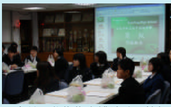
參訪同學彬彬有禮地聽取簡報

本校由於辦學績效有目共睹，外語教學成績斐然，連續四年獲得教育部國際文教處遴選為「台日文化交流訪問團」成員。今年一如往年，由本校「台日文化交流訪問團」成員，於三月廿九日搭機來台，展開為期一週的訪問。在訪問期間，團員們除了上課、逛夜市、參加 Homestay 外，還參加了許多文化活動，如參觀博物館、聽取簡報等。團員們對台灣的風土人情、教育制度、生活習慣等，都有著深刻的認識。在訪問期間，團員們也與本校師生進行了廣泛的交流，增進了彼此的了解和友誼。此次訪問活動，不僅增進了台日青少年之間的友誼，也促進了台日文化交流與合作。