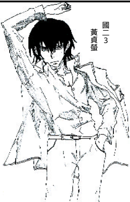
國二 3 黃貞瑩

十二月的三十一日的夜晚，如海沙般密集的人們環繞著台北101，每對閃爍的雙眸都蓄勢待發，渴望鎖住第一刻跨入新年的黎明。溢滿喜氣與招福象徵的春節則讓三代齊聚一堂，在炊金饌玉的年夜飯前飽享團圓之悅。專屬於偉大母親的康乃馨正是在五月的第二個星期日必備的心意。七夕情人節對於成雙的情侶們更是浪漫的鼎盛點。從歲初到歲末，每一個節慶都有著成千上萬的人共襄盛舉。 然而，撇開這些節慶，從一月一日到十二月三十一日，每一天對於不同的人都有著深淺不一的意涵。誕生的日子，溫存在心底，因為默默地置放在最靠近心跳的角落，也正和它給擁有者的意義相仿。反之，遠望屬於另一個人的生日，或許是為母難日的感懷與悼念，也可能只是單純對新生的禮讚，甚至面對已逝者的獻祭。雖然少了舉國歡慶的聲勢，但只因它的專屬，獨特的色彩已在黑白相映下而站上舞台。 「生日快樂」已經不再是