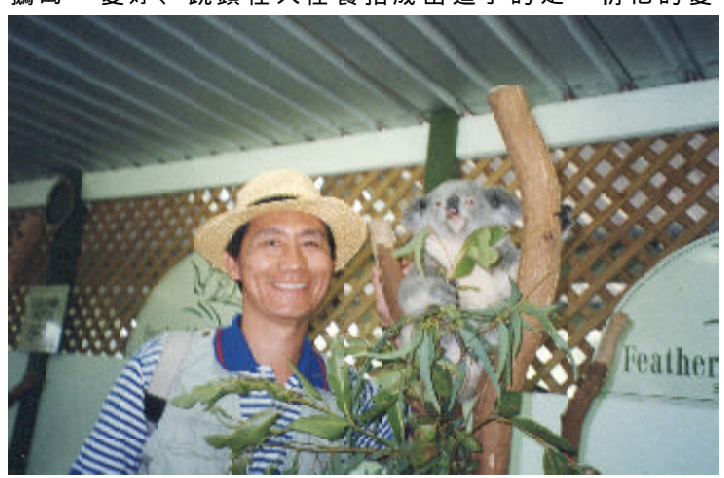
布里斯班農莊可愛無尾熊

惹人憐愛，在人類保護下，牠們得以繁衍不息。 袋鼠也是澳洲特有的動物，知道了袋鼠剛生出來時只有成人大拇指大小，必須養在媽媽袋裡一年多。大袋鼠袋子裡裝著探出頭的小袋鼠跳躍的姿態、情景，多好玩、多可愛！ 菲力浦島的神仙企鵝又是一絕！ 此種企鵝是全世界最小品種的企鵝，成年時只有三十分公分左右高，生性膽小。晚上九點鐘左右才從海裡上來，八點不到海灘特設的長排階梯已是人山人海了！遊客屏氣凝神，靜待神仙企鵝的出現。 九點鐘了！從海裡只冒出兩隻企鵝，神經兮兮、搖搖晃晃地四處張望，原來牠們是一「斤墩」，企鵝群先派兩隻從海裡出來偵察是否安全。一會兒，那兩隻斤墩又搖搖晃晃地往回走，沉入海中報告情況。 當牠們再出現時，則是一大群企鵝，小心翼翼地上沙灘，稍有風吹草動，全體企鵝即驚惶失措，拚命回頭跑，又沉入海中。過一會兒，再派兩隻斤墩出來偵察，沒問題了，又沉入海中通風報訊，接著又是一大群企鵝出來，忽然又集體慌慌張張地往回跑，沉入海中…… 如此多次反覆、小心戒慎才敢上岸，走到岸邊所築的窩巢中，將肚裡的小魚吐出來，餵養不能離巢入海覓食的小企鵝。 神仙企鵝小巧膽小、溫馴善良，充滿親子之愛及團隊精神，走起路來露出潔白的肚皮搖搖晃晃，非常可愛。 科倫濱島園的小鸚鵡也是可愛的「奇觀」，所謂「奇觀」是指從四面八方飛來的眾多野生小鸚鵡而言，而不是指鳥園裡養的那幾隻鸚鵡。 由於科倫濱島園鸚鵡區每天黃昏五點鐘時，會有人拿飼料餵飛來的野生鸚鵡，久而久之，「吃好到相報」，各地鸚鵡都飛過來，愈來愈多，以至於現在下午五點一到，鸚鵡區簡直是鸚鵡蔽天，蔚為奇觀。 鳥園管理生意腦筋動得快，販賣一盤盤飼料給遊客，有了鳥食，成群結隊的鸚鵡就飛下來，站在你的頭上、肩上，甚至盤子上啄食，十分可愛，不過都是因為你手上有牠們愛吃的鳥食，否則牠們才不「鳥」你呢！大家趁此機會趕快請人幫忙拍照，好拿回去炫耀。 享用夠了，鸚鵡成群呼嘯飛走，綠羽遮天，場面很是壯觀。 物小者必有可愛之處，無尾熊、袋鼠、神仙企鵝、綠鸚鵡，無異是上帝派來裝飾、美化澳洲的使者，難怪澳洲人那麼珍惜牠們，甚至以之為榮。