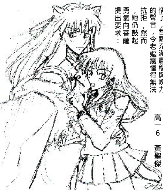
高一 6 黃聖傑

片片雪花飄飛著，融在好幾隻掌心上的小手上。那是我第一次——和雪景的「近距離接觸」。 一個陰雨綿綿的星期天下午，我從櫃子裡搬出好幾本厚厚的相簿，翻著、看著、回憶著以前的天真、以前的無憂無慮，然後我的眼睛定格在一張照片上，表面覆著一層層清晰的手指印，我從夾層中把它抽出來，仔細的看著。 灰灰的天空，夾雜著細碎的雪花，但一顆巨大的耶誕樹矗立著，搶過了鏡頭，佔了整張版面；一顆閃亮的裝飾星星，沒有一點污痕，立在耶誕樹頂上，雖然天色猶