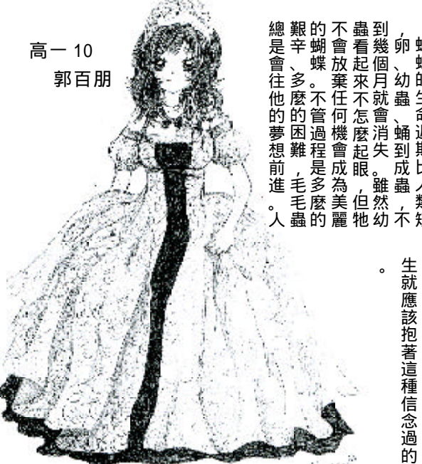
高一 10 郭百朋

威尼斯，一個風光明媚的城市，早在幾個世紀前，威尼斯共和國便是知名的國家，而在幾百年後的今天，威尼斯依然吸引許多外國旅客前來拜訪，在豔陽的照耀下水都已佇立在此好幾百年了。 然而，如此亮麗的城市，卻在海水上升的威脅中渡日，在這幾百年中，威尼斯的海水不知已上升了多少公尺，但在工業革命後所進行的石化燃料時代，從早期的煤炭到現在的石油，個個都產生了數量可觀的溫室氣體，而這些溫室氣體所造成的地球暖化，引發了一連串海平面上升的現象；上升的海水正一點一滴的啃蝕威尼斯