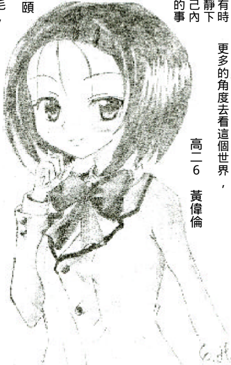
高二 6 黃偉倫

從環如身上，我看到了台灣戲劇界堅強不怕苦的韌性。她宛若是株沙漠玫瑰，就算被燥熱的氣候弄得乾枯，再拚命吸水，還是能盛放出一獨樹一格的美麗。做一行草一的衣服，她要親身練習書法；選「紅樓夢」所要使用的披風，她要從三百多匹花布中精選；為了一流浪者之歌，一服裝那種破舊的感覺，她既是咖啡又是茶的，奮力研發出新的比例。她內心有股堅持，凡事都不可以隨意交差了事。 書中有很多絢彩耀人的圖片，每件舞衣都出自她那飽經歷練的神奇雙手。她在劇場追夢，是隻名符其實的鶴女。鶴女的故事大家應該都不陌生：樵夫救了小鶴，小鶴長大後登門家貧窮的樵夫報恩，因為家裡沒錢，她日日挑燈織出驚人的錦繡支持家用。有天樵夫因為好奇，破戒推開門想知那些錦繡的來由，才發現原來這些