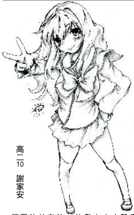
高二 10 謝家安

樹木因花點綴而亮麗；成就因努力而有價值；人性因善念而尊貴。在人生的角落中，往往自己的一句話、一個舉動、一瞬間的意念令人懼怕的漆黑點了一盞明燈，讓它溫暖、奪目。 走在回家的路上，心中吟唱著滿載而歸的喜悅，看著身旁隨著心靈音符婆娑的樹木。欣賞著雲朵飄飄然的自由，彷彿置身在桃花源中。