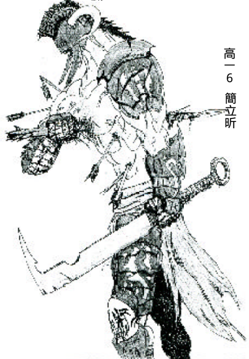
高一 6 簡立昕

後來，他沒有告別的去國外出差，我總定期收到明信片。我會在飯後去散步，以前忙功課到天昏地暗，現在才發現周遭的一切都值得記錄、寄情。國對方，卻也一直被對方打動。站在一旁，幾個大人微笑著，然後一個頸部掛著相機 去年，他在我生日當天回國，他的手結了一層層繭，他遞出一張照片，裡頭有一盞盞似棒棒糖的路燈，他掏出了一只懷錶，攔著我說：「孩子，爸爸是去國妳和我的夢，我拖了四十年，一直為了這個夢努力打拼，妳曾說過：『糖果國王，是我。』我用了用一切照亮孩子的童話世界，我錯過了享受生活的過去。孩子，別像我，啜飲生活的感動吧！放手去飛，用心去追！」爸爸哭了，我拭去他的淚：「你打錯了，照亮我心的路燈，沒錯！周遭是流質的，我會盡情去享受，接飲這甘汁玉露，謝謝爸爸。」我知道他埋在心中的懷錶已取出，照亮他心房的糖果國王。謝謝孩子的有效期限。謝謝他笑得開朗。我站在時間的尖塔上，俯瞰美好的人拍拍相機，說：「這會是她們最美的回憶！」