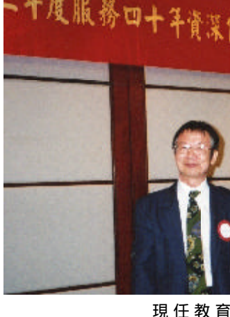
現任教育部長與作者合照

當時我是一自由青年半月刊的通訊員，藉著推銷雜誌的機會，我又認識了第三位女生，請她協助負責二年級女生的雜誌推銷工作。她長得嬌小玲瓏可愛，寫得一手好字，也愛好文學閱讀，她給我的情書讓我百讀不厭，真是最好的精神食糧。藉著推銷「自由青年半月刊」我每個月至少去她們兩次，時間大都是在晚自習前的一段空檔，我們總是在眾目睽睽下於教室走廊交談，正題之外，話題離不開文學寫作，談談自己讀過的課外書、交換心得、介紹好書。她們都鼓勵我多寫作投稿，每見有我的文章被刊出，就大加讚賞一番，讓我聽得醉醺醺的。有時我領到稿費就買些糖果餅乾來請她們，感謝她們的協助與鼓勵。為了引起她們們的注意，博得她們的讚賞好感，我更認真地閱讀，也更努力地寫作投稿，那一年我的寫作成果最好，收穫也最多。最興奮的是與她們的情誼也日漸深厚。我在課堂上也絲毫不敢鬆懈，學業成績突飛猛進，保持最高水準。