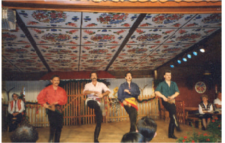
匈牙利民俗歌舞表演

由於觀眾大都是學生（那個時代還有一句流行語——考上台大、師大的學生就要先修「東南亞」的學分），大家品味、觀點相近，默契十足，全場反應熱烈，隨著劇情的進展時而哄堂大笑；時而唏噓讚嘆，無不被赫本的丰采傾倒。 當劇情推演到赫本飾演的公主，與演窮記者