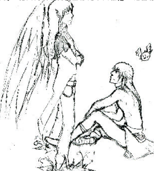
高一 1 白乃易

這本書與眾不同的地方，就是它提供了在課堂上學不到的歷史。以古為鏡，可以知興替，但很多我們所熟悉的歷史有時並不是真的。讀完這本書，我有了很多想法的改變。 現代醫學進步神速，是在許許多多錯誤的觀念堆積下才找到出路的。在中古時候，阿拉伯人的醫學技術非常先進，反觀西方因為沒有屍體可解剖、衛生習慣也不好，黑死病的肆虐加上連年的征戰，使得歐洲一直到工業革命之後經濟才開始有起色，而在之後落後醫學不但是司空見慣。但反觀現在的醫學，因為過度濫用疫苗和抗生素，使得能殺死病菌的藥物越來越少，我們會不會回到過去？未來我們的孩子孫看我們，會不會也像