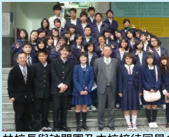
林校長與訪問團及本校接待同學合影

本校由於辦學績效有目共睹，外語教學成績斐然，連續四年獲得教育部國際文教處遴選為「台日文化交流訪問團」成員。今年一如往年，由本校「台日文化交流訪問團」成員，於三月廿九日搭機來台，展開為期一週的訪問。在訪問期間，團員們除了上課、逛夜市、參加 Homestay 外，還參加了許多文化活動，如參觀博物館、聽取簡報等。團員們對台灣的風土人情、教育制度、生活習慣等，都有著深刻的認識。在訪問期間，團員們也與本校師生進行了廣泛的交流，增進了彼此的了解和友誼。此次訪問活動，不僅增進了台日青少年之間的友誼，也促進了台日文化交流與合作。