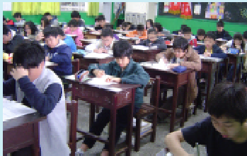
認真應試 爭取入學