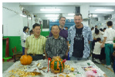
雕刻成品令人激賞