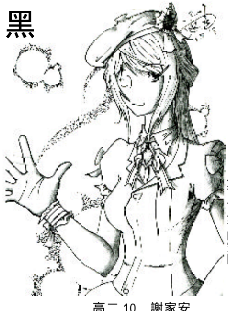
高二 10 謝家安

幸好現在不是夜晚，否則我會因為談論這個主題而全身發顫。 「黑」，一個介於抽象與寫實的深奧名詞，我想到黑，腦子便直覺地反射出黑色，像一團黑霧，它會一黑一黑地將任何事物吸入它那無形似有形的勢力範圍中，它是倔強的、傲慢的……殘酷的，這，就是黑的自私自利，而他最喜歡送別人的禮物，便是那份霸氣的恐懼，就如同失足掉進黑洞，黑暗中成千上萬隻手向你攆來，企圖將你拉往更深處，更深…… 我已進入黑洞中，收到黑贈予我的禮物，張眼是黑，閉眼是黑，身外恐懼，內心亦然。