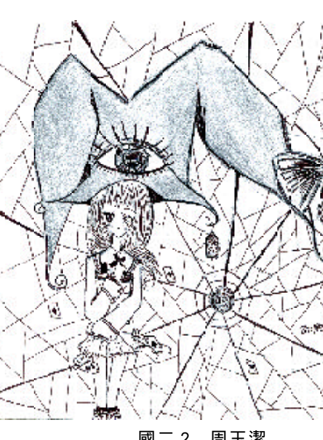
國二 2 周玉潔

白米價格上漲兩倍，小麥也漲價，就連玉米、黃豆等穀類的價錢皆創下歷史新高。到底是誰在搞鬼？還是天災？還是人禍呢？我已從這當中找到了答案。 許多專家，也都依照自己本身的事業和觀點提出了不同的見解。有人說氣候變遷造成糧食總產量下降，也有人說油價上漲，而使大量的穀物被提煉成替代能源，進一步扭曲市場供需關係。更有人說，部分農業國家工業化，減少耕地，造成糧食價格上揚，然而我個人認為主要的問題還是——「人類」，為什麼？理由很簡單，要不是人們之前大量消耗石油能源，現在會有石油危機嗎？那還需要某些穀物作替代能源嗎？我想應該不用，因為如果