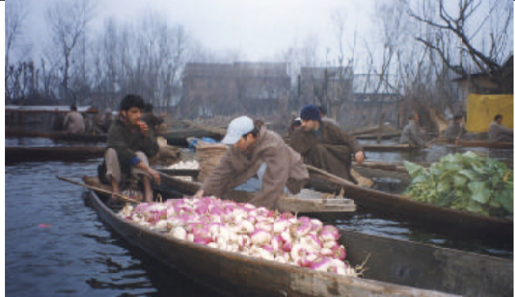
達爾湖清晨水上交易

今年寒假有機會旅遊印度，喀什米爾當然不能錯過，但從德里飛往喀什米爾首府斯利那加(Srinagar)卻波折重重一再delay，這時才知印度國內班機go down是正常，不是才反常。go down了好幾個小時總算上了飛機，誰知到了斯利那加機場，更見識了最嚴密的機場檢查，處於隨時可能爆發獨立戰爭的喀什米爾，到處都是荷槍實彈的軍人，印度政府的機場檢查自然嚴酷，從機場內一直檢查到機場外，不下五、六關，全身被摸透透，連鼠蹊都被掰開抓得癢癢的，而相機的電池上機前都要拿下，另行托運，也是前所未有的。