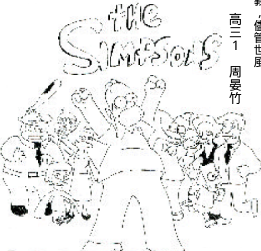
高三 1 周晏竹

百代之過客，而夾於餘時空此兩限制下數十餘載的我們，若除去自己的人生意義和所堅持的事物，不過只是具空有皮囊的行屍走肉爾爾。 保有自己人性純潔的光不滅，在亂世中作一劑清流便是我的人生意義，儘管世風日下，棄禮義，捐廉恥之人與日俱增，欠缺品格的知識，欠缺勞動的財富，欠缺倫理的科技…… 等印度聖雄甘地所言之七大罪狀，在身邊不斷上演，白前報章上登載的圓明園風首，免首競標一事，更令人痛心疾首，我不