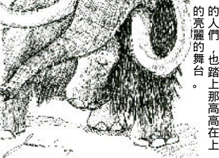
國二 2 蔣佳芸

從小到大，因為先天條件好，幾乎什麼事都暢行無阻，學什麼會什麼，眾人的讚美和驚呼聲更是沒停過，而我也自以為地高高在上，但是雖然是在高處，少了競爭對手，日子卻是枯燥得很，連我有時想要一高談闊論一番時，我所說的話似乎就變成了「外星話」，一處不勝一處，同儕們討論學問時無法接軌，孤獨的感也愈益加深。