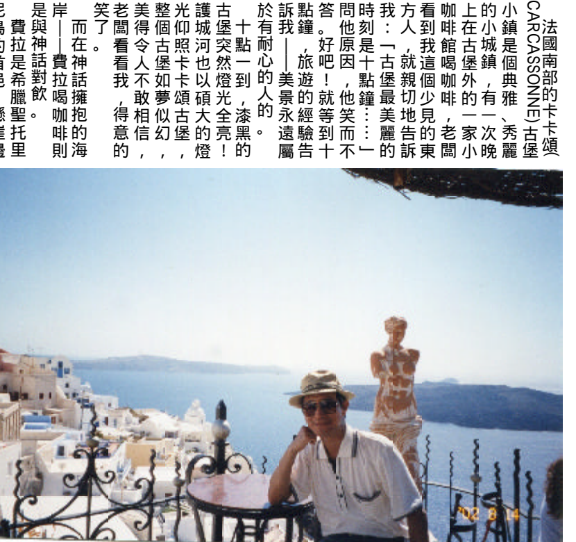
費拉海崖露天咖啡座

順著扶梯而下，於霧、酒香、汗味瀰漫著這個酒屋改裝的酒館。對！這就對了！這才是真正佛朗明哥舞的氛圍與格調，不是國父紀念館中正紀念館的布蘭卡黛瑞、荷西莫里納、西班牙芭蕾舞團的學術化佛朗明哥舞，而是道道地地江湖味、草根性的西班牙佛朗明哥舞。 吉他手調了調弦，舞臺上場了，穿著艷麗舞衣的舞者在舞臺的椅子上排排坐，個個神情亢奮、蓄勢待發。 吉他手促絃轉急，如簫間雨滴轉為傾盆大雨；如潺潺溪流轉為驚濤拍岸。舞者輪流起身表演，昂頭、抬臂、後跟皮鞋擊地，裙襖猛力一甩，荷葉邊裙化為朵朵激石浪花，舞得狂放奔肆、縱情放蕩。 有一個舞孃尤為美艷多姿，口含一朵紅艷欲滴的玫瑰，性感的紅唇、火熱的眼波瀲灩每個觀眾，手上舞動的響板與腳下急速的點踏相應相和——熱情、奔放、叛逆……聲聲擊擊人心，台上下「HOLE-HOLE……」之聲如雷貫耳，舞孃將口含的紅玫瑰拋向觀眾，舞得更狂熱、更熾烈。 樂聲由急轉緩，並非一舞的將盡，而是另一高潮的蓄釀。吉他聲再度高亢揚起，坐在椅子上的男舞者站起來，以迅雷般密集點踏舞向舞孃，舞姿陽剛、爆烈、滿溢力與美——拍掌拍出了渴求；響板敲出了激情；點踏踏出了狂野。冷峻的眼光再也掩不住痛苦的癡愛，與舞孃一陣糾纏、火辣辣的狂舞後，一刀刺入舞孃腹中，吉他的聲、舞孃戛然而止，酒館爆出熱烈的掌聲、叫好聲。 一舞既罷，一舞又起，吉他聲、歌聲、拍掌、響板、吶喊……以及舞者與觀眾內心激起的撞擊聲，足可將酒館爆裂、燃燒。 一舞低楊柳樓心月，歌盡桃花扇底風，這樣的夜是很「佛朗明哥」的，就讓他舞得夠、唱得夠吧！ 夜總會過去的，舞也有的時候，曲終人散時，我走過化妝間，無意間瞥見剛剛在舞臺上那個俊帥、意氣風發的男舞者，一個人坐在鏡前猛抽菸，臉上殘妝未了，假髮則已拿下，燈光映在光逸風光的舞者；下場卻只是個孤獨的中年男子，落寞的流浪藝人。啊！好辛酸，酸得人生！他面對化妝鏡是在檢視什麼？是在回味什麼？是在感嘆什麼？抑或只是單純的面鏡卸妝而已。 一天下本無事，庸人自擾之一又何必多情，多情反被無情惱，多情也只是落得個早生華髮而已，還是個到異國尋求短暫浪漫的旅人，還是盡情陶醉在這狂放、熱情的舞蹈裏，好好享受這一時的風華吧！ 啊！綁架我吧！誘惑我吧！佛朗明哥舞。