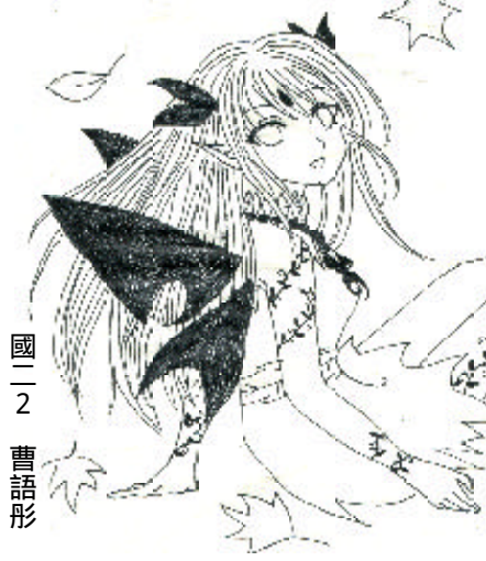
國二 2 曹語彤

古語云：「十年寒窗無人問，一舉成名天下知。」一定都有一個書桌，陪伴他們讀過各大經典，和他一起做著一舉成名的夢。聞名的文人墨客，一定都有一張書桌，備著磨好的墨，等待文思泉湧的揮毫。