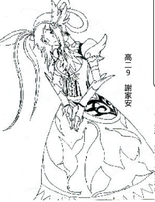
高一 9 謝家安

新學期在暑假結束後隨之粉墨登場。對我而言，這是一個新的學習生涯，因此我想送給自己的三樣禮物，以提醒我心中的期許及冀望。 一把看似平凡的鑰匙是我對自己最重要的期許。為了要事半功倍；為了不露聲色，我找到正確的讀書方法是我極需面對的課題。因此我希望擁有一把通往學習大門的鑰匙，在我徬徨時，在我不知該走進哪扇學習之門時，這把智慧鑰匙將會指引我走入成功的康莊大道。 潔白如雪，輕柔如羽的棉花是我內心中最渴望的禮物。因為它象徵著單純過往的自己。經過歲月洗禮，生命經驗逐漸累積，雖然豐富了我的生活閱歷，但原先那單純的自己及內心的本真卻日漸模糊。唯有看著純白的棉花，我才能想起那個單純的自己，只有對知識的好奇，不受任何雜事的干擾。 最後一份禮物是一把刻度分明、中規中矩的直尺。它可時時警惕我待人接物的方式，提醒我不可輕易踰矩，跨越人與人的安全距離，造成彼此的不悅。而尺上清晰的刻度也可讓我衡量判斷每個人的特質，進而明白是否該與之深交。因此這心中的尺便是調整自己態度的良方。 三樣禮物象徵著三份期許，他們可以惕勉自己，也可以鼓舞自己。當我失意挫敗時，他們就如同一盞明燈照亮整個世界，使我相信堅持下去寓意深刻的小禮物會在我未來的高中生涯撫慰我沮喪的靈魂，並給予我重新出發的力量。