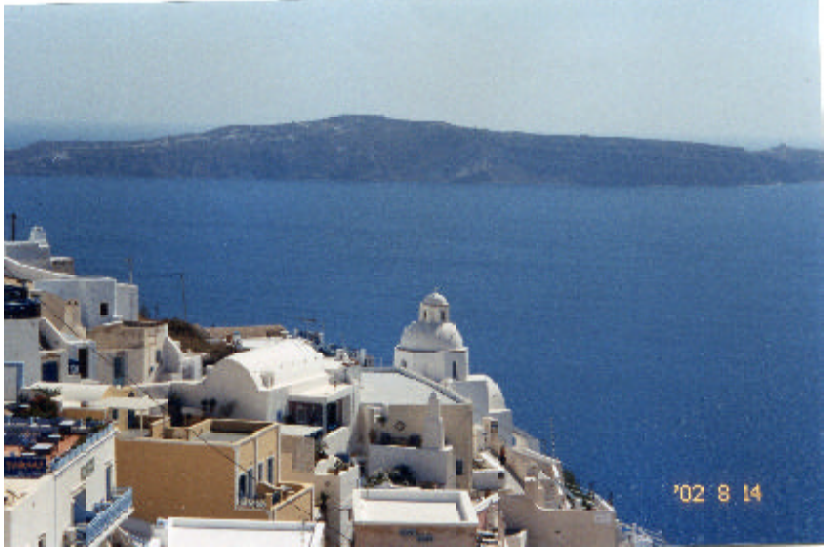
聖托里尼島首邑費拉海崖美景

如果你到奧地利薩爾茲堡下的莫札特街（格特拉克街）咖啡館，請你靜靜瀏覽，因整條街創意十足、精巧精緻的店招牌就已夠賞心悅目了，更何況整條街還一直有著音樂——地靈人傑、人文薈萃的莫札特街街頭藝人個個技藝非凡，大提琴、小提琴、手風琴、長笛、排笛、風笛……仙樂飄飄處處聞。 當你喝口濃濃的維也納咖啡，眼光隨著音樂的翅膀，飛向莫札特特出的那棟大樓的三樓窗口，那麼多年來想瞻仰音樂神童的宿願已達成了。 費拉海崖法國梧桐樹下的露天咖啡座，在彩霞逐漸褪去、夜晚剛降臨時更見風華，河面捎來淡淡懶懶的風，遊船燈光璀璨，悠悠穿梭。抬頭一看，燈火燦爛的艾菲爾塔就在你眼前，此時喝一口濃郁的歐陸咖啡，多麼優雅自在，彷彿整個巴黎都為你明亮。