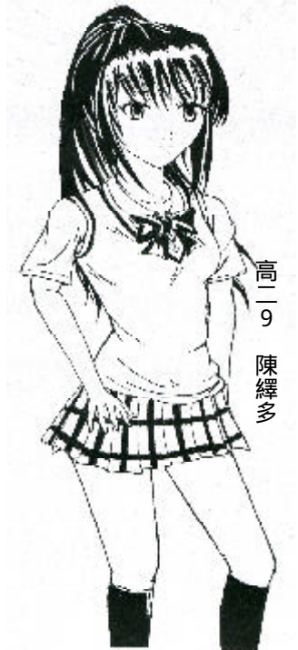
高三 9 陳繹多

橙色，是我崇敬的顏色，代表著理想、目標，就像照亮大地的太陽，遠高掛天邊，活化的整片土地，更溫暖了每個人的心。 我愛橙色是有原因的，是曾有過的一段往事。讓我一直一直尊敬著這個顏色。在小學三年級，我的班導師是全