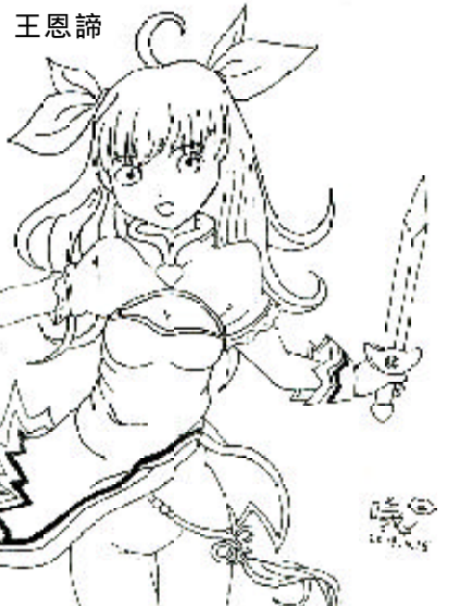
高一 8 曾鈞昱

胡塞尼筆下的瑪黎安和萊拉所承受的殘酷人生，讓人無法相信世上竟能存在如此悲慘的境遇，各樣的煎熬苦難看似難以置信，卻也緊緊抓住了讀者的的心。作者皆以第三人稱的角度作故事的鋪陳，但在每一個段落前都會以「瑪黎安」和「萊拉」分別出現做為標題，在當篇作者似乎也將那觀看事物的鏡頭集中在兩人身上，使我在閱讀時能夠身臨其境，試著以兩人大大小小不同的價值觀來面對阿富汗女性在砲火和暴虐下所強壓在心底的憤怒。作者的文字簡單，樸實無華，卻在細膩的筆觸下道出書中人物的生命質地，描繪出變化多端的人間感情，他喜歡以白描的手法，使各個時期的背景和氣氛，不需華美動人的景物描繪，就能深深觸動讀者的心弦，讓人讀來欲罷不能。