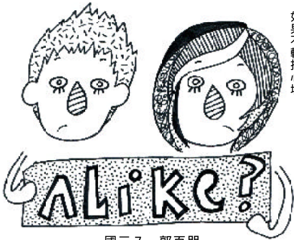
國三 7 郭百朋

受一條條我們無法理解的線牽絆，一顆晶瑩剔透的水晶球，除了受到一好精緻的讚美外，更關乎我們未知的未來，然而，真是如此嗎？我們只不過是因害怕及無知而不得不信吧！ 據說前陣子圓寂的聖嚴法師曾算命，老師說，他會娶三個老婆；想當初選舉前，老師說，連戰先生的面相較會當選；最近更傳出陳前總統受黃姓少年的塔羅牌受騙。看來，命運是無法一語道盡的，更不是幾條紋紋或幾張紙牌可以決定的。