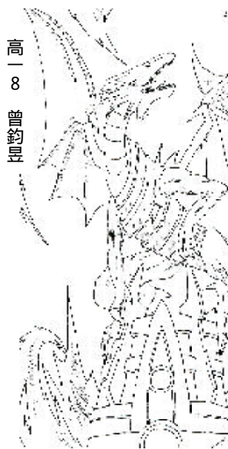
高一 8 曾鈞昱