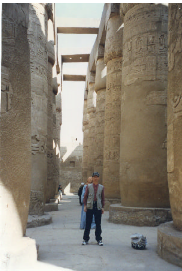
路克索「卡納克神殿」的列柱大廳

人的偏好是長髮。經過這番別具用心的相親檢驗，若合格，男方母親就拿一粒硬椰棗放在對方女孩手中。接下來才是男女相親，若雙方中意，即可談婚禮。天啊！身材若是一太平公主，或一貧如洗的話，豈不完了嗎？埃及新娘！真難為妳們了！