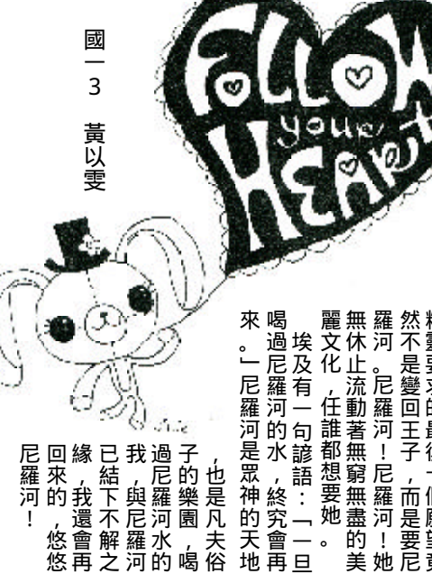
國一 3 黃以雯

世界名著《一千零一夜》中的阿拉丁，在緊要關頭向精靈要求的最後一個願望竟然不是變回王子，而是要尼羅河。尼羅河！尼羅河！她無休止流動著無窮無盡的美麗文化，任誰都想要她。 埃及有一句諺語：「一旦喝過尼羅河的水，終究會再來。」尼羅河是眾神的天地，也是凡夫俗子的樂園，喝過尼羅河的水，我與尼羅河的緣，我還會再回來的，悠悠尼羅河！