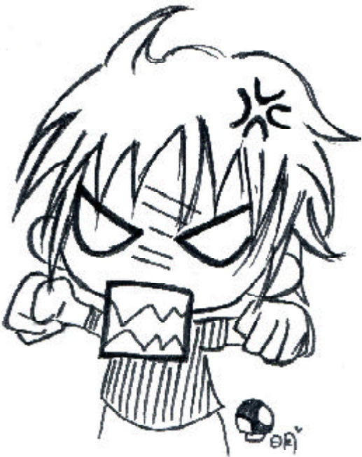
高二 1 徐明安

五元，兩枚銅板敲出單薄的聲響，經過路口，看見有人舉著牌子，手中還拿著捐款箱，一經細看，原來是要為四川大地震募款，我二话不說掏出身上一僅有的十五元，一咚一聲投入洞口，而在臨走時，他溫柔地附贈一句：「祝你學業進步。」頓時我心裡覺得好溫暖，就像有一股暖流從心底流過，溫暖了全身，我帶著滿足的笑容和他道別，並期待這些小錢能對災民有所幫助，雖然只是小小的一份心意，但能藉此把愛心傳遞出去，我覺得非常值得。