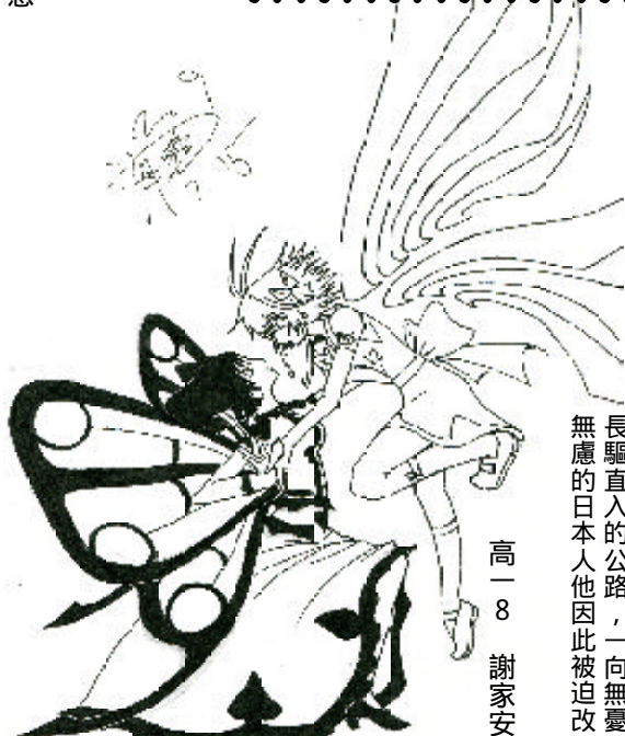
高一 8 謝家安