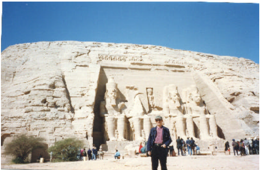
阿布辛貝爾拉美西斯二世神殿

則在亞斯文水庫建成後，這大、小神殿就得淹沒於水中了。 有一「尼羅河之珠」美譽的伊西斯神殿也是如此，硬是克服重重困難，將之遷至現今的菲來島，以避亞斯文水庫建壩之後的水難。古人造神殿，今人使神殿復活，古今輝映，相得益彰，古文明才得以綿延不絕。 尼羅河幽幽地流著，兩岸帶狀綠洲鋪寫了古文明的歷史、傳奇，森森河水敘述著文化的源流、浩大。 遊輪往北順流而下，抵達康翁坡。兩座相連而分別祭祀何爾斯（鳥頭神）、賈克（鱷魚神）的神殿，那富麗精美的浮雕與迷人的水道設計，不僅令人擊節讚歎、流連忘返，似乎還可聽到古人的聲音與氣息，也讓人想像了兩千三百多年前埃及人的生活。