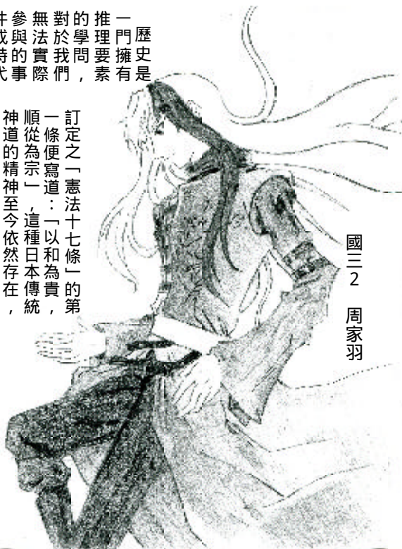
國三 2 周家羽

訂定之「憲法十七條」的第一條便寫道：「以和為貴，順從為宗」，這種日本傳統神道的精神至今依然存在，破壞「一和」的人是不受歡迎的，過度突出的人容易令人反感，於是「讓一」也成了日本人共同的精神，因此早期的日本並不盛行實力主義，直到後來室町幕府權力低下導致弱肉強食的戰國時代開始。而一海洋一也不可否認的主宰了日本部份的歷史，過去交通不便的年代，海洋是阻礙了外來勢力的天然屏障，它阻礙了外來勢力的入侵，進而創造出日本獨特的文化。但隨著工業革命、交通革新，最保護日本的海洋卻背叛了它。蒸氣船的發明，讓天障屏障變成了令侵略者無慮的直入的公路，一向無憂無慮的日本人因此被迫改