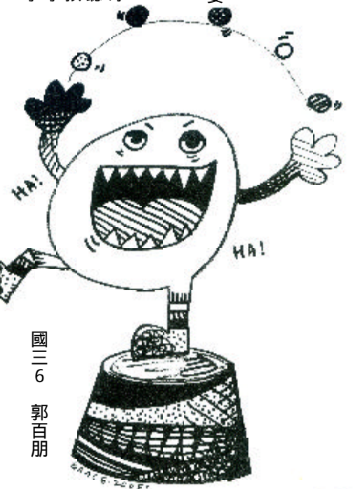
國三 6 郭百朋

「吃一飯了！一大表哥故意拖長了尾音大喊。」一聽到這個聲音，我們一群小孩子紛紛爬上餐桌，所有筷子的目標都朝向——紅燒獅子頭。 除夕，是一個闔家團圓的日子。其中，年夜飯更是重頭戲，也是奶奶大展身手的好時機。但這年，一我要做這句震驚全家的話——「我，我要做紅燒獅子頭！」 爺爺年輕的時候觀念十分保守，堅信「男不外，女不內」，所以從來沒有下過廚房。後來，孩子長大了，奶奶也把廚房視為一女人的聖地。而現在，爺爺完全無視於我們的驚訝，興致高昂的換了一襲白衣，還把堂哥那頂附有黑色勾勾的帽子，看起就像上了年紀的俏皮廚師。 自認為「五星級大廚」的爺爺拿著菜刀與鍋鏟，像即將出征的士兵一樣邁進廚房。不過最緊張的還是奶奶，只聽見她不停地用高分貝大喊：「你這個不行這樣用！」「你會燒到手啦！」「哪有人刀子這樣切的！」之類的話。我們就像貓鼠的好奇，一直想進去看看，卻被擋在門外，不得其門而入。 左等右等後，爺爺滿頭大汗的端著一鍋紅燒獅子頭走出來，後面跟著緊張的奶奶。那獅子頭的香味鑽進我們的鼻腔，戰勝了嗅覺神經。獅子頭則隨著鍋子左右搖擺，好像對我們招手，進行誘人的呼喚，鼓舞著我們。一口咬去，香味四溢的肉汁與甜而不膩的高麗菜在口中大跳華爾滋，讓我的味覺完全折服。吞下去的那一瞬間，我所有的感官暫時停止運作，整个人沉浸在幸福的滋味裡。再喝一口湯，那宛若瓊漿玉液的味道讓我再次沉醉。看著我們心滿意足的神情，爺爺那張佈滿皺紋的臉上浮漾著驕傲與滿足的笑容。