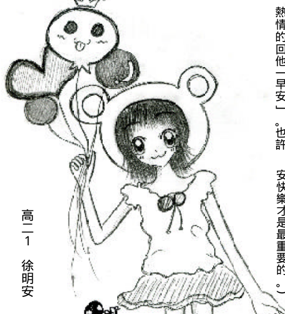
高一 1 徐明安

然充滿綠意的景色一一浮現腦海，歷歷在目，像如電影般幕幕變換，我陶醉在其中，直到曲終，久久不能自己。