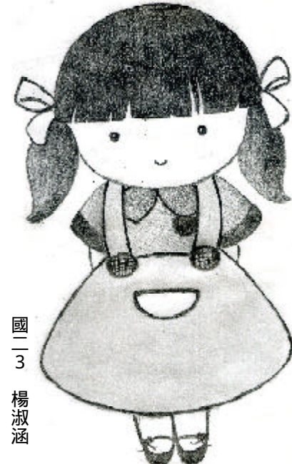
國二 3 楊淑涵