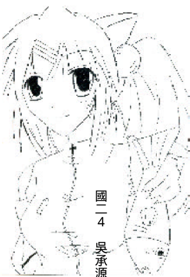
國二 4 吳承源

在這個班級裡，我最了解，也是最了解我的人就是「朱瑞翔」了。一個跟我相處兩年多的活潑男孩。五年級開始，我們就被分在同一班，很投緣地就彼此認識了。有時會在同一組裡，就從那一起，我們成了很要好的朋友。 他，長得矮矮小小的，就是有那麼一點的胖，其實他增一分則太肥，減一分則太瘦的纖纖合度。擁有一張童心未泯，充滿稚氣的臉，軟軟的，捏起來很舒服！戴著一副藍框眼鏡，頭髮又短又刺。走路時，腳跟微微抬起，屁股往後翹，十分逗趣，遠遠一望就知道是他了！他的笑聲更足以使人發笑！ 他非常外向，開朗又活潑大方，只是他有個壞習慣——驕傲自滿，但現在有些改變了。他脾氣滿好的，個性溫順，總會靜靜聆聽我說的