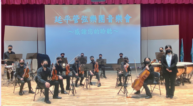
延平管弦樂團音樂會 ~感謝您的聆聽~ 是《星際大戰》之原力覺醒》、莫札特的《第三號弦樂四重奏》、品編號K 156，第一樂章》、蕭士塔高維契的《第八號弦樂四重奏》、第二樂章》、布拉姆斯的《第五號與第六號匈牙利舞曲》，最後是本澤尚之的《向夜晚奔去》壓軸。

雖然目前樂團的人數僅有十幾位，但是各個團員皆盡心為此場音樂會做許多練習呢！另外，其中演出《第三號弦樂四重奏》、作品編號K 156，第一樂章》的弦樂四重奏可是榮獲台北市音樂比賽優等殊榮的優秀團體！若同學也有興趣加入延平管弦樂團，即日起皆可向學務處社團活動組報名！