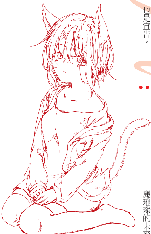
繪圖 / 高一5 盧宣諭

起雨來；就如同一帆風順的道路也會有高低起伏、驚濤駭浪。而我們的友情，似乎就在某一天的爭執中分裂了，後來事情更是雪上加霜，我們見到彼此都不互相聊天，對到眼也會氣憤的回頭。這樣的情況持續了一、二個月，最後彼此也因受不了這種情況而和好，並約定不要再吵架了。而這次的事情雖然使我們友情低落，但也讓我更加珍惜彼此的友情。