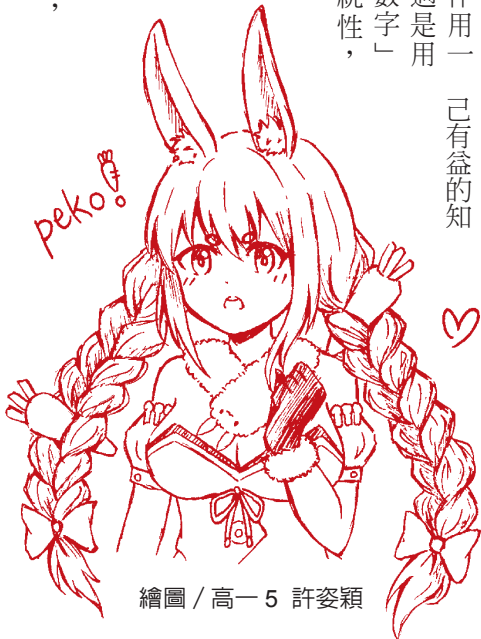
繪圖 / 高一5 許姿穎

我迷茫的眼神透出一絲希望的光彩，期盼我們這個糊塗世代，將會有所清醒，成為一個積極、客觀且自主的世代。