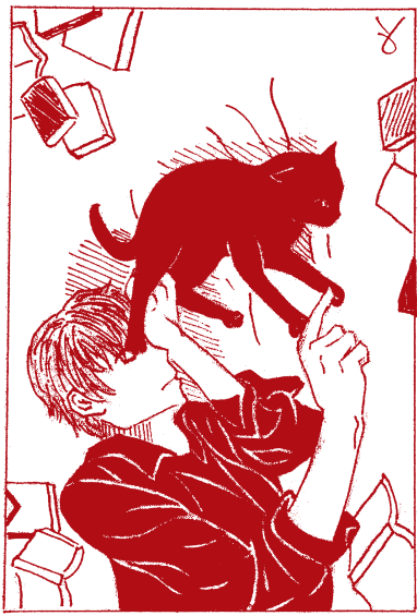
繪圖 / 高三8 郭小瑀

是一般人承受得起、願意去做的。世界充斥著缺憾，有時人性固然殘忍，但最為殘酷的莫過於光陰和歲月，不可逆且不得人。儘管蝶衣與小樓是風靡一時的角兒，擁有滿城的掌聲和眾人的青睞，但隨著年華漸逝，再輝煌耀眼的日子終究會成為過往，都只是曾經。戲裡，段小樓是威風凜凜的西楚霸王，可對於人生，青春才是霸王。時光的洪流不僅傷人，亦傷文化，曾大受歡迎的傳統京戲，也難逃衰落的命運，在現代已逐漸沒落。可是同樣的，那些悲傷、痛苦、遺憾的經歷，總會變成過去的一部份，不需要我們一直放在心上，反覆後悔著、埋怨著，不但於事無補，更會為現在的自己增添負擔。看見蝶衣忘不掉對師哥的感情，深陷於戲臺上的角色脫不了身，我想起新聞上一次又一次的自