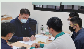
▲模擬面試照片 - 教授書審指導