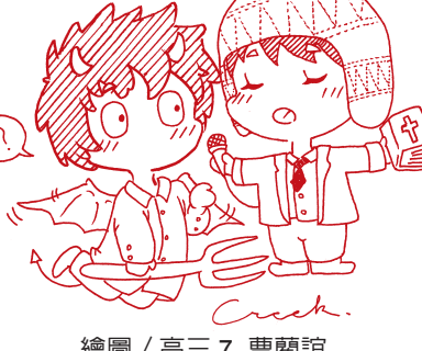
繪圖 / 高三7 曹蘭詒

「麝香貓咖啡」這類從非洲、中南美洲來的外來種咖啡幾乎是占下了咖啡市場所有的席位，但是台灣自產的「台灣咖啡」反而鮮爲人知。張萊恩，被譽爲是台灣咖啡的先驅，他因爲愛家鄉，愛古坑，而決定將家中的遺產咖啡，山中所種植的咖啡豆發揚光大，凡