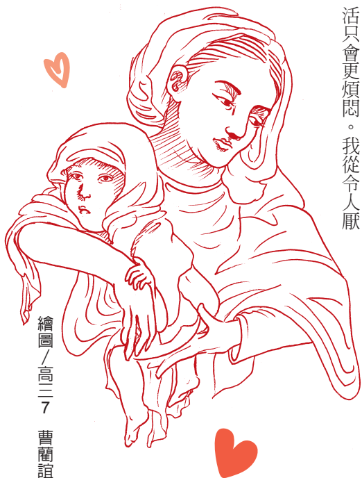
繪圖 / 高三7 曹蘭誼

自閉症患者的特徵是情緒表達困難、社交互動障礙、語言和非語言的溝通問題，在日常中，表現出限制的行為與重複的動作和明顯的特定興趣。在面對這類患者時，我們需要用極大的耐心及被拒絕的勇氣來與他們互動，因為他們活在自己的想像裡，不會輕易走出自己的舒適圈，擁有與一般人截然不同的思想，也因為他們有著比一般人更單純、更簡單的心，才能在天空中散發出屬於自己的光彩。