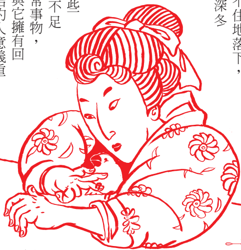
繪圖 / 高三7 曹蘭誼

大，「雨」就是我心目中的存在，或許它是孩子們出門玩耍的阻礙、是上班族最抑鬱的天氣，但於我而言，雨是我和爺爺的連繫與回憶，情意深遠。