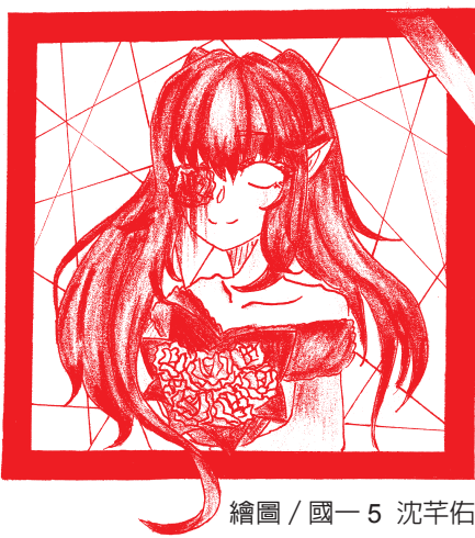
繪圖 / 國一5 沈芊佑

人與人之間的相處十分複雜，曾經的知心好友可能再見時已無話可說，只無奈的默默一笑。但是，當我們看到曾經在上課時傳的紙條、卡片，上面幼稚的話語和無厘頭的插圖，又再次提醒我們，當初的你和他，曾經形影不離、無話不談。「時間，是讓人猝不及防的東西」，它會帶走我們以為會一直陪著我們的，會摧毀我