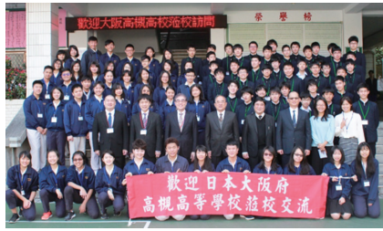
歡迎日本大阪府高槻高等學校蒞校參訪

高槻高校至今已連續第四年蒞臨本校，活動除了有臺日雙方學生相見歡聯誼，更由學生主持文化交流節目，透過簡報與戲劇，讓日方學生了解台灣的春節習俗。另外也安排了包餃子活動，讓日方學生體驗台灣人在過年期間，吃元寶討喜的氣氛。日方學生則是以小組報告方式，分享各種國際性議題，如糧食短缺、泰國經濟問題、浴廁衛生的重要性等。