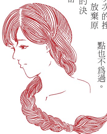
繪圖 / 高一 6 曹蘭誼

讀完這本書，我從他逐夢的點點滴滴中了解到他對生命的體悟，也從他身上印證了一句靜思語：「信心、毅力、勇氣三者具備，則天下沒有做不到的事。」他的故事深深的感動了我，他教會我：不管遇到什麼困難，保持熱情和笑容，然後給自己一點力量。或許世界上沒有奇蹟，但可以自己創造奇蹟。陳彥博多次創下亞洲首位、最年輕完賽紀錄，也多次奪得總冠軍，並持續地在創造奇蹟，稱他為「台灣之光」一點也不為過。