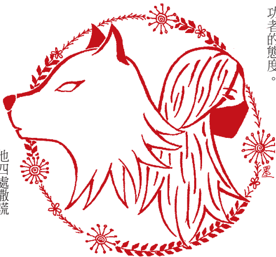
繪圖 / 國三8 郭小瑀

長井鞠子是日本口譯界的第一把交椅，她說：「努力和準備，不會背叛你。」投入職場半個世紀，手寫的筆記從不離身，戒慎的心情不會鬆懈，站在百尺竿頭上，要求自己更進一步；同樣不可或缺的要素——執忱，長井鞠子在書中反覆提到，比起僑民擁有語言的優勢，「有沒有想傳達的熱忱」更為重要，因為口譯最終的目的，是能夠設身處地，並且打動對方的心。我想，不論是何種職業，都必須投入全心全意，並將事情做好做滿，這就是成功者的態度。