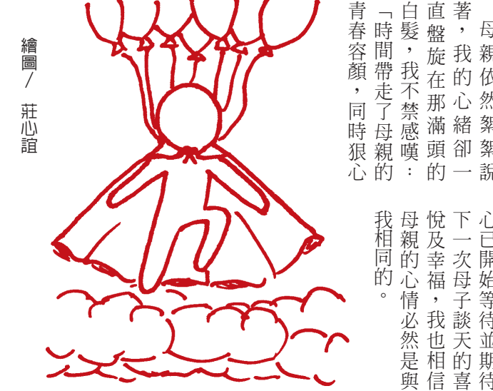
繪圖 / 莊心誼

有人天生完美，要放下身段，謙卑學習。蘇格拉底曾說：「我所知者是我一無所知。」從失敗錯誤中學習，把握人生，追尋課本以外的世界，而這過程，是值得我們細細品味。 追尋目標，要免除自己「怕輸」的態度，若只選擇自己熟悉無害的方式，是無法突破的。聖經上說：「划到深處去，撒網捕魚吧！」突破遮蔽一切濃霧，才能划到生命深處，看見生命的精采。