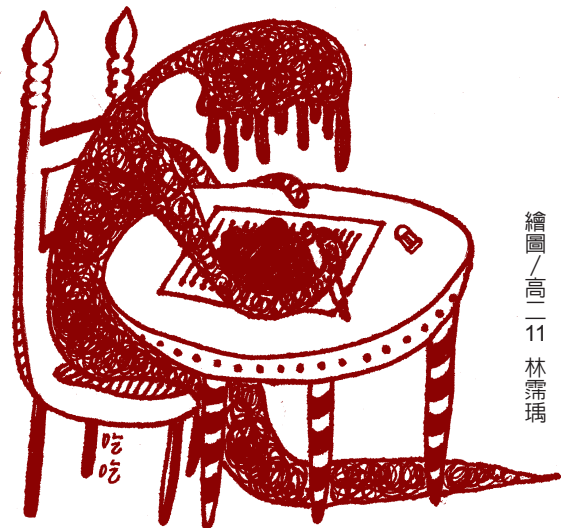
繪圖 / 高一11 林霽瑤

直到校門外的車流慢慢散去，心心念念的身影終於走入眼簾，衝向母親溫暖的懷抱，幾個小時累積下的委屈終於從雙目溢出，淚水止也止不住。雖然哭得難受，但至少懸著的一顆心踏實了。 這段等待是苦澀的，任誰也不願再經歷一次，可是若我的家人在未來又讓我體驗無止盡的等待，我必無怨言。因為他們是我的珍寶，我願意。