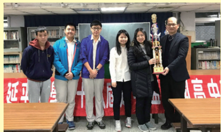
延平中學及臺北市，批袍上陣，挺進台中！

雖然我們不是一支正宗校隊，但我們卻擁有與校隊一樣的運動家精神。比賽期間感謝家長們的熱情支持，全程協助拍攝選手們影片、照片，以