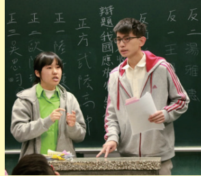
2018/2/3二天的比賽更吸引眾多友校同學及辯論界人士共同聆聽參與，也感謝自延平畢業的辯論社校友們，為籌備比賽、裁判事務投入眾多心力。

更吸引眾多友校同學及辯論界人士共同聆聽參與，也感謝自延平畢業的辯論社校友們，為籌備比賽、裁判事務投入眾多心力。比賽最終由麗山中學演辯社榮獲亞軍，謝秉諭、陳茵琪同學為優秀辯士。 (活動組長 蕭政宏)