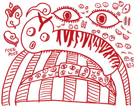
繪圖 / 高二 11 張焯祺

長大後，隨父母搬到了臺北，偶爾回去探望外公和外婆，每一次外婆都會站在門口迎接我們，而我的視線除了許久不見的外婆之外，就是那棵挺立在門口的芭樂樹，關心它的土壤是否維持應有的濕潤色澤，看看它有沒有更加茁壯，觀察它有沒有結出芭樂果。不過