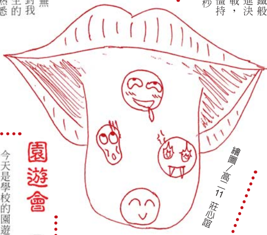
繪圖 / 高一 莊沁璇