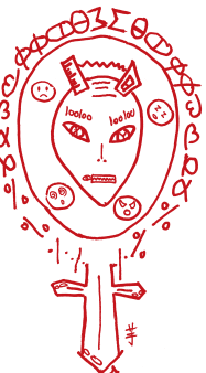
繪圖 / 高二11 莊心誼