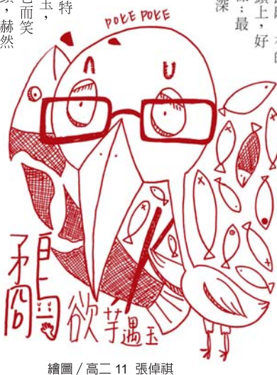
繪圖 / 高二 11 張仲祺

淨，我心滿意足的，漾起了一個微微的笑。心情極亢奮。豔麗的陽光悠然普照。汗水憑那股強勁的執著黏在脖子上，附在頭髮裡——跳在心頭上。耐不住熱，去買了冰。百香果口味的冰，酸與甜匯成的幸福。冰溶得飛快的，吃著吃著，它竟已成了水，緩緩的滴在我的手上。平時，應感到