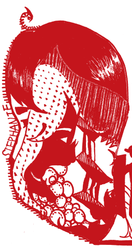
繪圖 / 國三 謝欣芸