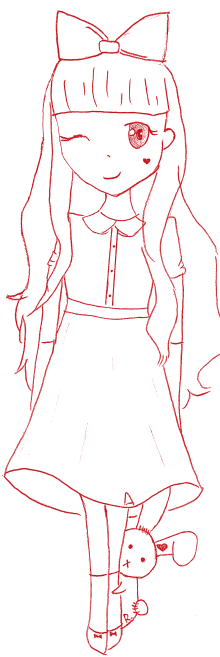
繪圖/國三 4 蘇子喬

我們拿著豆漿坐在補習班的花園前寫功課，每隔幾分鐘我就拉一下珍妮姊姊的袖口：「姊姊，姊姊，這題不會。」她仔細地跟我解釋了題目，讓我自己寫算式。她一邊看我做題目，一邊幫我改算式，比我都認真了。到了上課時間，我功課還沒做完，豆漿倒是喝完了，就開始打珍妮姊姊那杯的主意。而她也總是不負我的期待，沒喝幾口就對我說：「姊姊喝不完了，芊芊幫姊姊喝好不好？」我點頭如搗蒜，很高興能夠「幫忙」。孩子們嘻嘻哈哈的聲音將我找回現實，身邊哪裡還有珍妮姊姊的身影？她早已隨初夏的畢業歌聲程萬里，這麼多年來，杳無音訊，而我也不再是跟在她身後的小孩子了。只是每