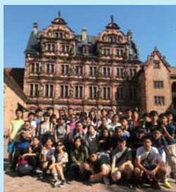
海外參訪團成員合影

2017年夏天，即使全球恐攻威脅，延平的海外教育參訪團依然踏進英國，來到Thefield High School和地球另一端的學生們進行學術與文化的交流。相見歡的儀式中，雖然兩校的學生臉上都掛著不著內心的悸動，台灣學生在學伴的帶領下魚貫離開集會場，走向課桌上的教室，開始為期兩週的學習之旅。課程應有盡有，有趣的例如戲劇，學生見識到英國學伴的落落大方；數學課，台灣學生完全展現亞洲學生的數學實力，令英國學伴與課程重實作，學生更樂於跟學伴討論、主動完成實驗，這比起老師說教了嘴更來得成就感十足；電腦課認真聆聽；音樂課的樂器琳瑯滿目，老師親自指導彈奏，學生徜徉音樂殿堂，好奇地探索；體育課是最為大家所推崇的，校園遼闊，在安全無虞的前提下，英國師長非常樂意讓台灣學生參與，藍天、綠地、白雲、棒球、標槍、板球，樣樣都來，值得一提的，期間正巧碰上Thefield的運動會，倉促成軍的台灣好手，可沒失了延平的面子，四人接力的項目勇奪冠軍，讓原本替自己學校加油打氣的Thefield學生也倒戈揮舞台灣學生帶去的國旗，跟著替台灣加油！就連沒在計畫中的防火演習，疏散到操場的紀律與整隊效率也讓英國師長刮目相看，當然，我們也見識到英國人對規則的嚴謹，演習還真的是突如其來，沒有驚慌失措，取而代之的是扎實操作！ 週末出遊是少不了的，畢竟來到英國這樣的大國，如果只是蹲坐教室學習知識，未免如底之蛙。著名景點例如溫莎城堡，伊莉莎白女王偶爾會來居住，來朝聖王室文化的學生，當然不能錯過。一進門就目睹一場仲夏露天音樂會，更往深處走，遊客戴著可愛高帽的英國士兵擦身而過，饒富樂趣！哈利波特的影城，絕對是許多學生力！聽完導覽後推開門的一霎那，映入眼簾的是哈利波特電影中的集會大廳場景，下一秒鐘相機拍照聲此起彼落，行程結束前不再錯過。如果你還沒喝過奶油啤酒（它只是啤酒！），相信我，一定要來嘗一次，滋味香甜無比；如果你體驗過飛天掃帚在你喝令一聲UP！立即到手，一定要來嘗一次；如果你也想推著一車的行李撞向9又4分之3月台留下倩影，那就更要來一次；相信這個景點在每個波特迷學生心中一定留下深刻不已的回憶！學術參訪怎能錯過牛津？莫德林學院是牛津眾多學院當中的一個，經過超水準藍牌導遊的導覽，讓大家都了解原來豆豉先生也是牛津高材生，原來納尼亞曾在哪個街區取景，哪個書店有全世界最大的書櫃、牛津的教授用心每週一次要面試更讓牛津大學之