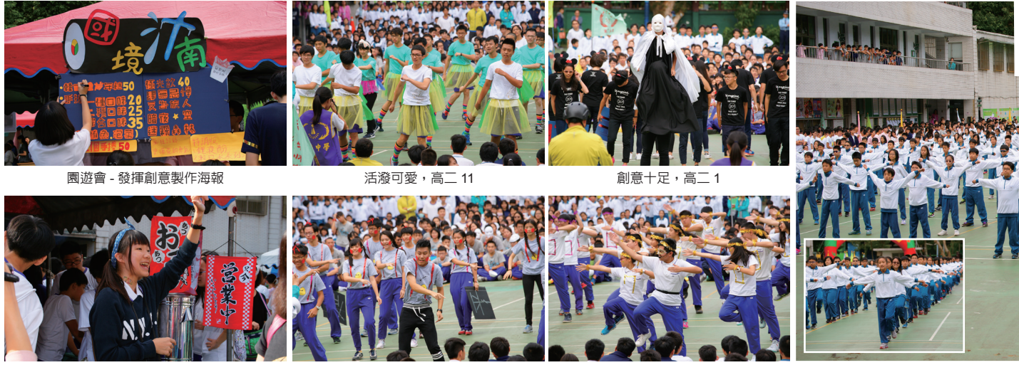
園遊會 - 發揮創意製作海報 活潑可愛，高二11 創意十足，高二1 園遊會 - 認真熱情的叫賣 熱情奔放，高二6 活力四射，高二9 精神抖擻的國一大會操