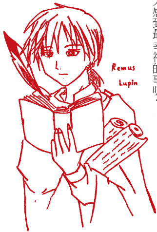
繪圖 / 高二6 曾潔禎