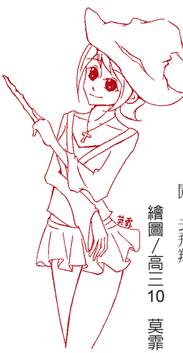
繪圖 / 高三10 莫罪

流行可以滿足心理上的榮譽感，也可能使你誤入歧途，然而大部份的人還是選擇跟隨流行，但這並不是什麼壞事。只是總是在流行前端的你，有時不妨停下來腳步，去尋找自己真心喜愛的東西，創造那屬於自己的流行，這樣會更有意義。