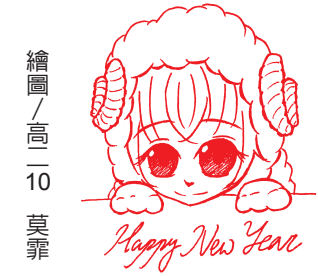
繪圖 / 高一10 莫霏

我發現，其實在蒐集這些特殊貨幣之餘，有養成儲蓄的習慣，不只是紅包錢能儲蓄，媽媽每天給的零用錢，地上撿到的錢，只要沒用完，當然會把它存起來，現在物價高揚，有錢不一定萬萬皆能，沒錢卻是萬萬不能，所以儲蓄的習慣對現代人來講是相當的重要啊！