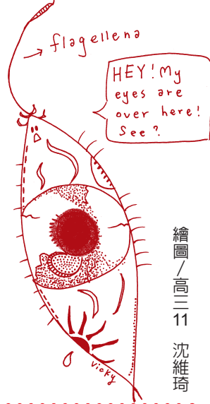
繪圖 / 高三11 沈維琦