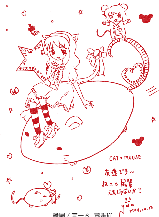
繪圖 / 高一6 蕭雅瑜