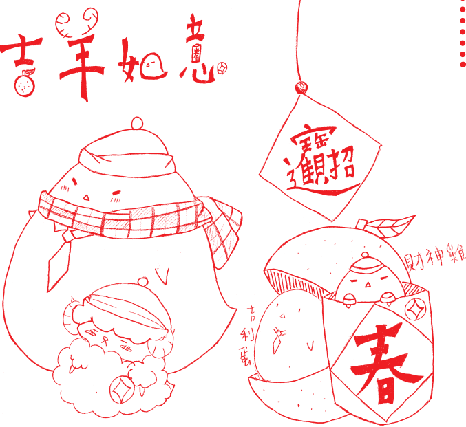
繪圖 / 國三4 黃子庭

單又是什麼？人從出生時就是一個人到來，死亡時更是一個人的離去。在一生中，又有誰能永恆的陪伴自己呢？有首歌是這樣唱的：「我總是一個人在練習一個人，寂寞是腳跟，回憶是凹痕，也沒有人見證。」