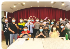
校外參訪-研討會合照