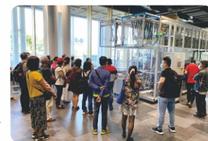
校外參訪-參觀自動還書機

掌握閱讀行為趨勢與轉變，熟悉閱讀推廣活動的規劃與設計，藉以創意推展各類閱讀活動。