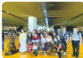
校外參訪-南市圖合照

以「培養具有社會關懷與法學觀之圖資人」為指導原則。本課程主在提供圖書館從業人員法務相關所需之基礎知識，訓練法學邏輯思考的能力，期達致以融會貫通之智慧解決各種繁雜法律問題的目標。