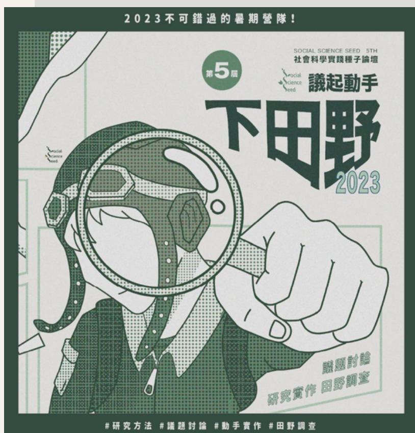
上圖為本年度（2023）暑期營隊「議起動手下田野」宣傳圖

本屆營隊以「議起動手下田野」為主題，遵循過往的活動形式，以豐富的「議題討論」與「實作課程」為活動主軸。透過交流思辨的方式讓學員得以對於不同議題有更廣且深的認識，並結合實地走訪、田野調查等活動項目，讓學員能夠理解議題背景、脈絡與不同利害關係人的觀點，學習研究議題的方法。此外，我們也有安排多元活動，包括青春放映所、科系介紹與議題RPG等活動，讓學員能透過多元的活動參與認識社會科學不同的面貌。