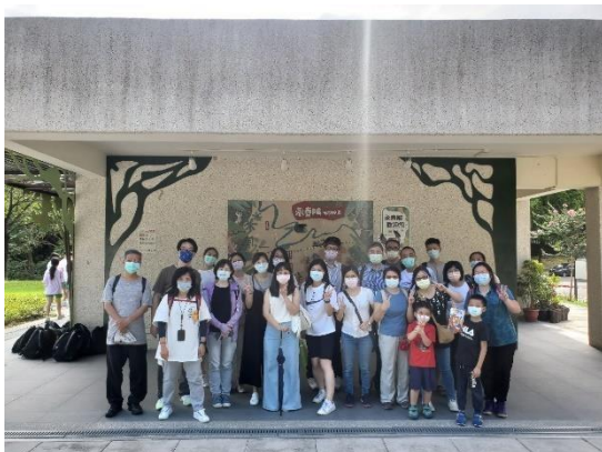
永春埤濕地公園導覽讀前合照