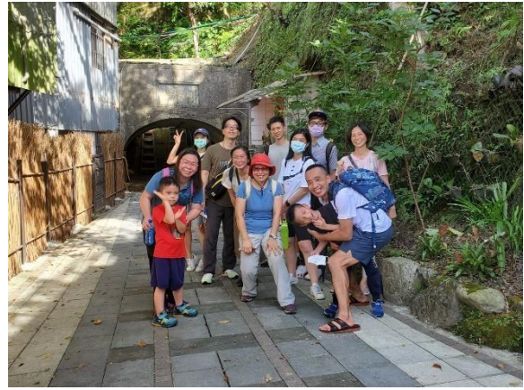
松山一號煤礦坑口遺址