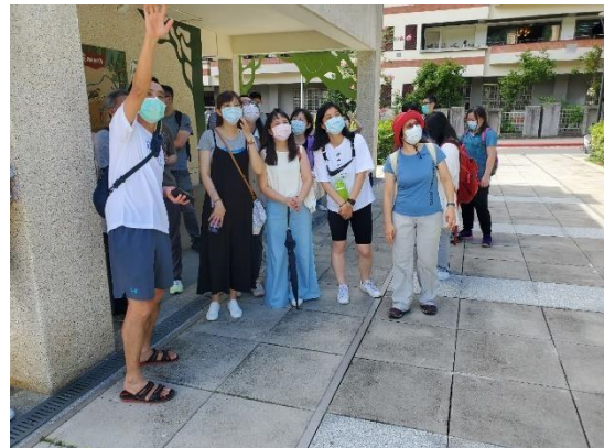
從溼地公園看虎山