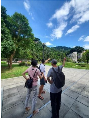
從溼地公園遠眺象山